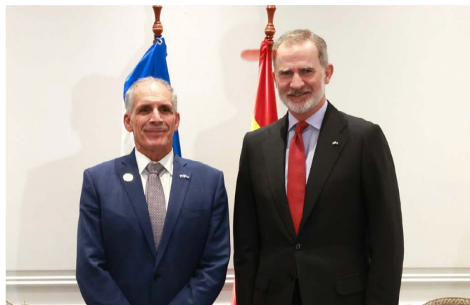
Presidente Nasry Asfura se reúne con el Rey Felipe VI previo a la toma de posesión en Chile Pág. 08