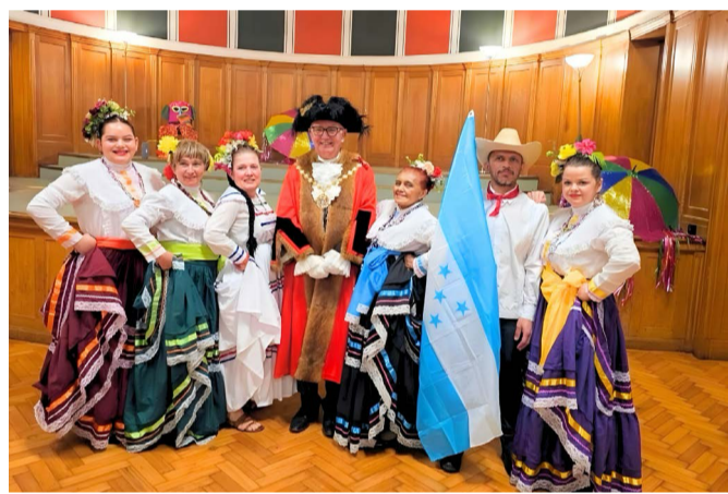
Grupo de Danza Folclórica Orgullo Catracho Honduras UK participa en ceremonia de entrega de medallas en Londres Pág. 02