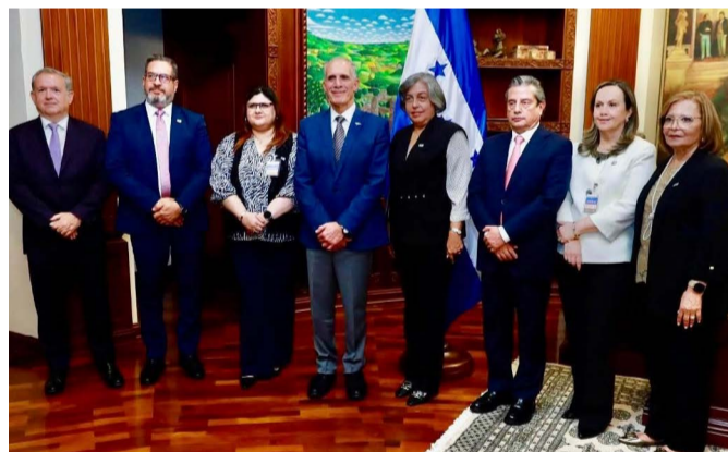
Honduras será sede del gran encuentro del turismo iberoamericano Pág. 08