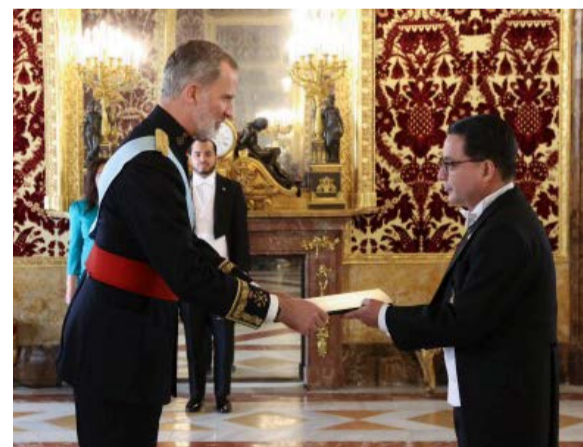
Marlon Brevé Reyes: una gestión diplomática que fortaleció los vínculos entre Honduras y España Pág. 20